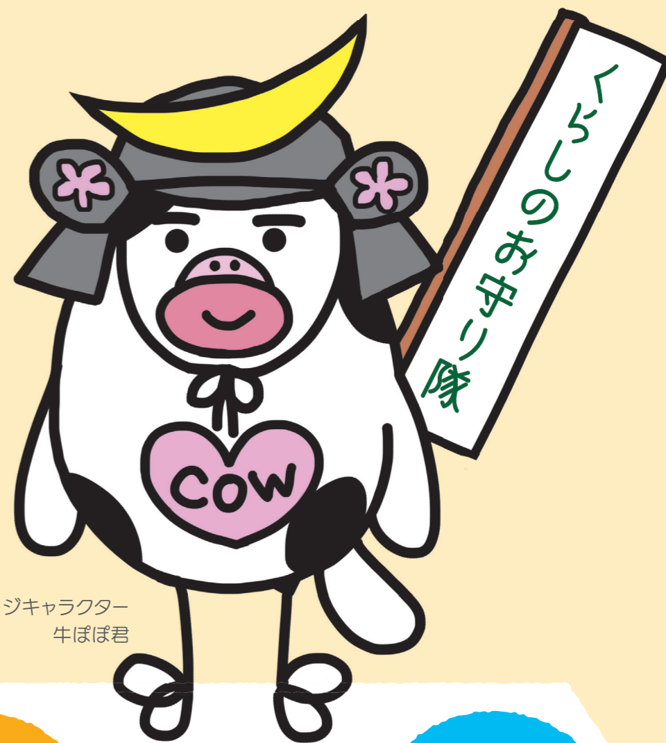
イメージキャラクター 牛ぼぼ君